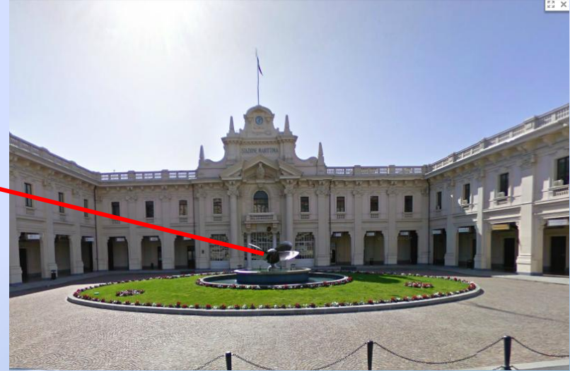
Salida de la Estación Marítima.